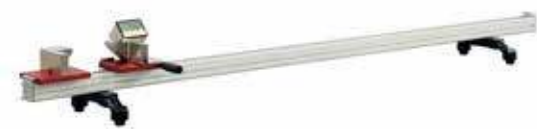
DLG 100 - DLG 200 - DLG 300 - DLG 550 Dijital boy ölçme cihazı DLG 100 - DLG 200 - DLG 300 - DLG 550 Digital length gauge Устройство для измерения длины профиля DLG 100 - DLG 200 - DLG 300 - DLG 550