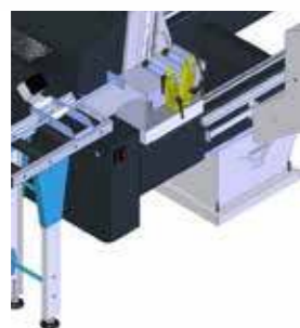
Kısa profil kesme sistemi Short cut system Упор для установки длины профиля